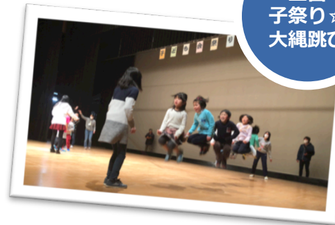
二宮子祭り☆大縄跳び

●ラディアンには二宮町の誇る自慢のホールがあります。このホールのステージに立つ経験を多くの子供たちにして欲しいとの思いから、今年度の役員が意見を出し合い「子祭り☆大縄跳び」を実施しました。初めての試みでどの位の参加があるのか不安はあったものの、当日希望の参加も受け入れた結果、予想以上の参加がありました。当日は客席の応援も賑やかに縄を回す大人も真剣になり、子供も大人も一丸となって盛り上がり、 地域の方々の絆が深まる企画 となりました。（本部）