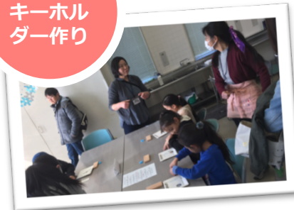
バッジ・キーホルダー作り

●バッジは50人、キーホルダーは200人に参加していただきました。みんな楽しんでいました（元町北）