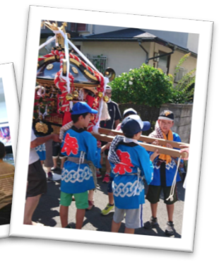
夏祭り 子ども神輿 (富士見が丘1)