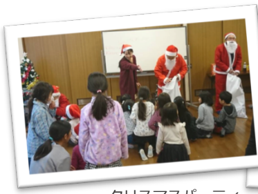
クリスマスパーティ (元町北)

二宮町には、16の単位子ども会があり、それぞれに、楽しい独自のイベントを実施しています。くわしくは、お住いの地区の子ども会役員または、子育て連本部にお問合わせください。