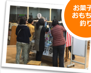
お菓子&おもちゃ! 釣り

●おかしやおもちゃは260個用意していましたが、1時半で完売終了してしまい、数が足りませんでした。子どもたちに喜んでいただけ、役員一同、大変なところもありましたが、楽しかったと思っております。（百合が丘）