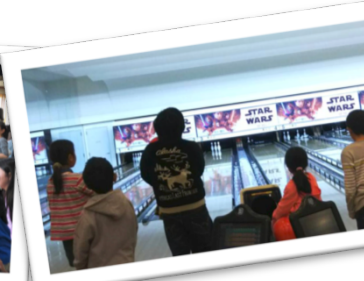
ボーリング大会 (茶屋)