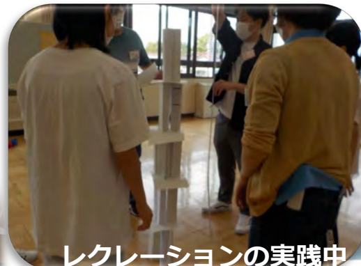
レクリエーションの実践中