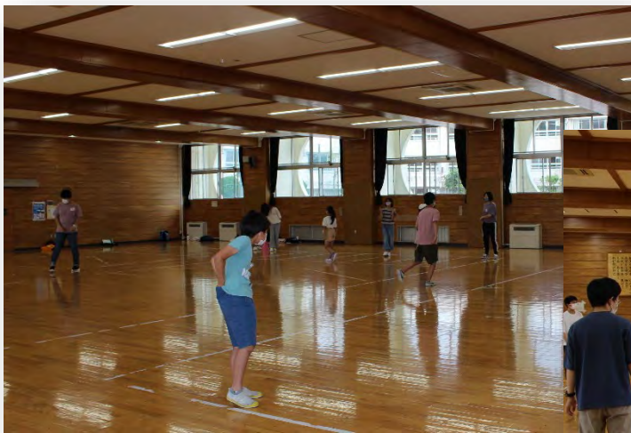
開講式後にレクゲームを実施（密にならないように配慮しました）