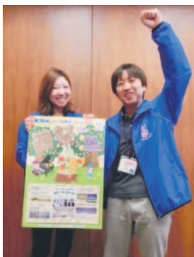
西祭と一緒に盛り上げませんか

期①11月7日(土)②11月11日(水)～18日(水) 所西市民センター 対高校生以上(18歳未満は保護者の同意が必要) 申問区振興課、西部出張所、区内各公民館で配布、または区ホームページからダウンロードした申込書を10月2日(金)必着で西区イベント推進会議事務局(〒819-8501住所不要、区振興課内 ☎895-7032 F885-0467 ✉shinko.NWO@city.fukuoka.lg.jp)へ郵送、ファクス、メールまたは直接持参。活動日・場所は、決定後に連絡します。