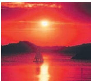
小戸公園からの夕日

期8月29日(土)午後4時～7時 所小戸公園(小戸二丁目)※雨天時は市ヨットハーバークラブハウス2階無料 申不要 問同推進会事務局(区振興課内) ☎895-7032 F885-0467