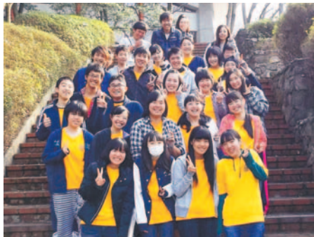
ジュニアリーダーの皆さん

活動の一つに、校区子ども会の代表(小学生)約120人が集う「子どもリーダー一泊研修」があります。現在、その開催に向けて準備が進んでいます。