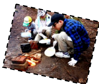
ごはんをはんごうで！