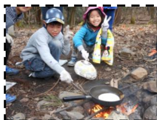
えだをもやして火をつけたよ！