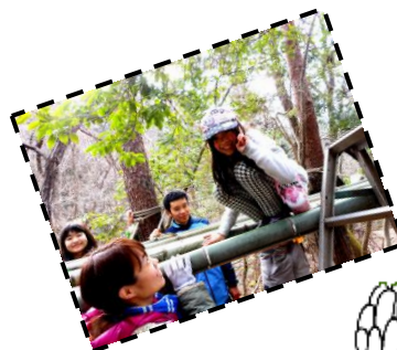
木の上のひみつきち！