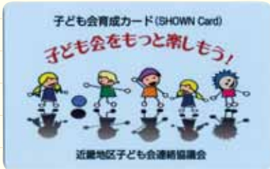
子ども会育成カード (SHOWN Card)

その一環として、当会では「子ども会活動ハンドブック」「子ども会育成カード (SHOWN Card)」を発行し、県内の各単位子ども会に1セット配布しています。