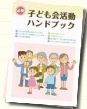
子ども会活動ハンドブック

2018年度から、近畿地区子ども会連絡協議会〔滋賀県子ども会連合会・和歌山県子ども会連絡会・(一社)大阪府子ども会育成連合会・奈良県子ども会連合会・(一社)兵庫県子ども会連合会〕が共同し、「未来の子ども会のカタチプロジェクト」を始動しました。