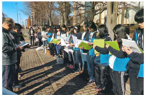
事前活動の限られた時間の中でプログラムについて立案～運営まで打合せを重ねてきたジュニア・リーダー(中高生)たちです。