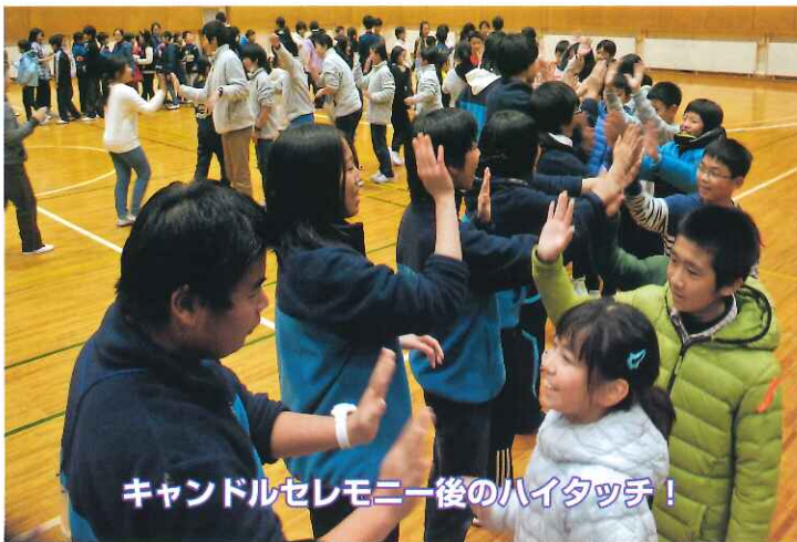
キャンドルセレモニー後のハイタッチ！

本番は晴天に恵まれ!?「雪がない」ことが心配されましたが、交流の家に着いた日の夜から雪が降りだしました。みなさんの願いが通じ、翌朝外を見ると一面雪景色♪ 「わー！今年になって初めて雪を見た！」と、参加者の輝く笑顔をたくさん見ることができました。