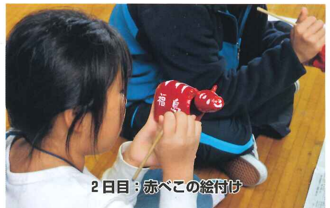
2日目：赤べこの絵付け

経験は人を成長させます。 みんなでお互いを高め合える よりよいリーダー大会にしていきましょう！ 「憧れ」を胸に 中学生リーダー 高校生 OB・OG・・・へと、 これからもつながっていきますように