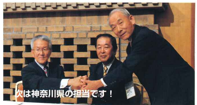
次は神奈川県を担当です!

※ 分科会で出ました質疑の回答を茨子連HPにて公開しています。 今後の活動, 運営にぜひお役立て下さい。