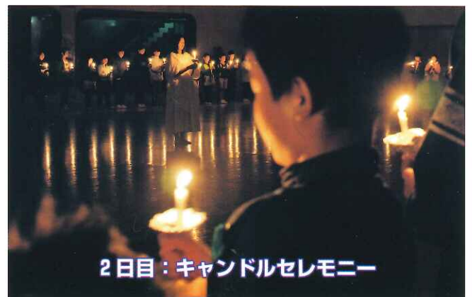
2日目：キャンドルセレモニー