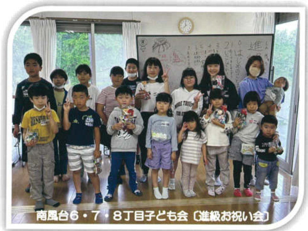
南風台6・7・8丁目子ども会〔進級お祝い会〕

4月は、南風校区の多くの子ども会で、新入学・進級をお祝いする楽しい催しが行われました。