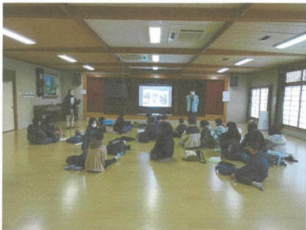
子ども会の運営についての講義