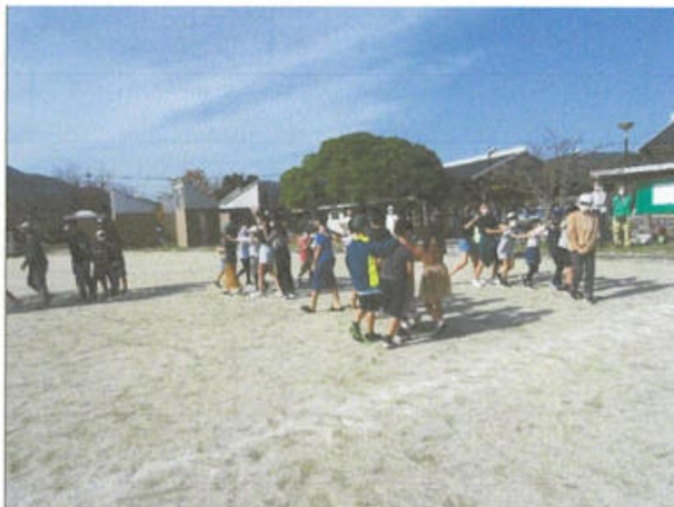
じゃんけん列車の様子