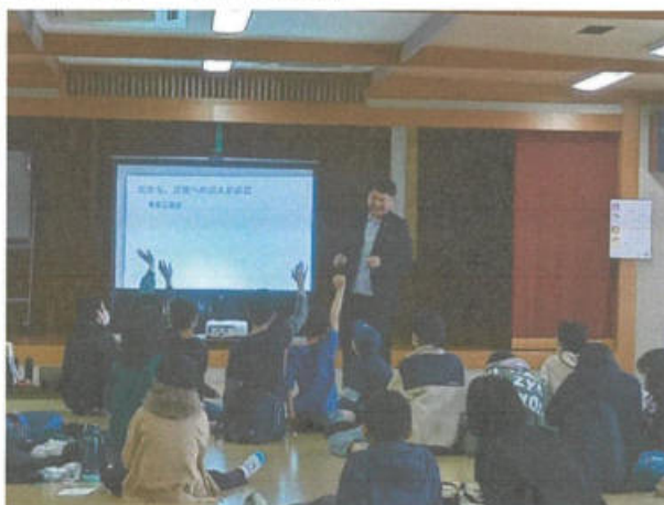
天気予報についての講義