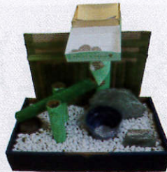
県商工連合会会頭賞