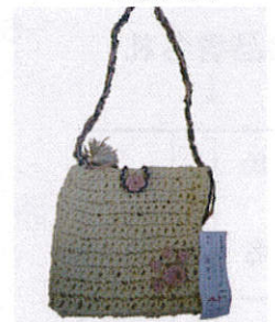
ガールスカウト神奈川県 連盟長賞