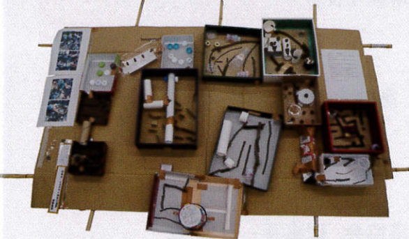
【工作の部】ボーイスカウト神奈川連盟理事長賞