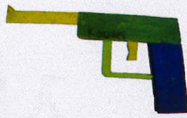
ボーイスカウト神奈川連盟 理事長賞