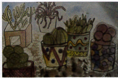
県教育委員会教育長賞