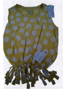
県子ども会 連絡協議会会長賞