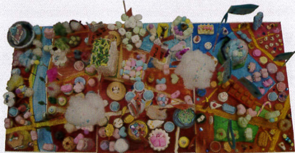
県少年少女育成指導協会理事長賞