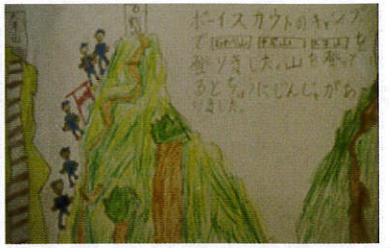
神奈川新聞社長賞