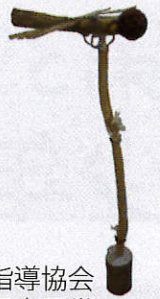
県少年少女育成指導協会 理事長賞