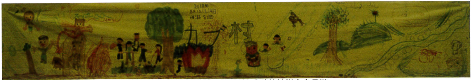
【工作の部(団体)】 県子ども会連絡協議会会長賞