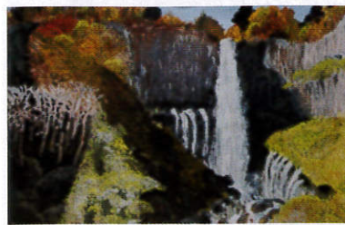
【絵画の部】 神奈川県知事賞