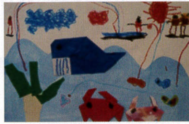
県少年少女育成指導協会理事長賞