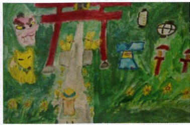
県商工連合会会頭賞