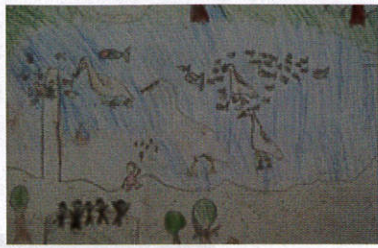
県子ども会連絡協議会会長賞