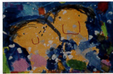
ガールスカウト神奈川県連盟長賞