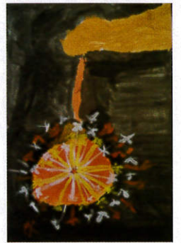
ボーイスカウト神奈川連盟 理事長賞