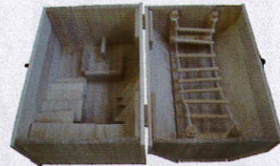
神奈川新聞社長賞