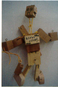
第40回入賞作品より 【工作の部】 ガールスカウト神奈川県連盟長賞