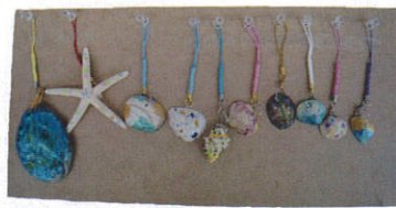
県商工連合会会頭賞