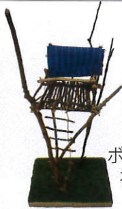
ボーイスカウト 神奈川連盟 理事長賞