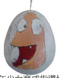
県少年少女育成指導協会 理事長賞