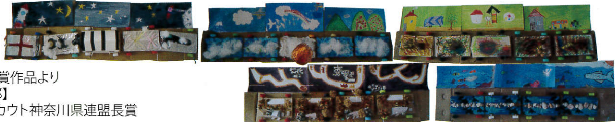
【工作の部(団体)】神奈川県少年少女育成指導協会理事長賞