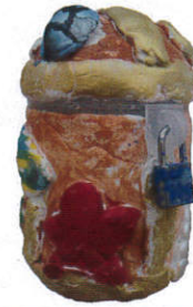
神奈川新聞 社長賞