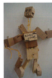
【過去の受賞作品より】