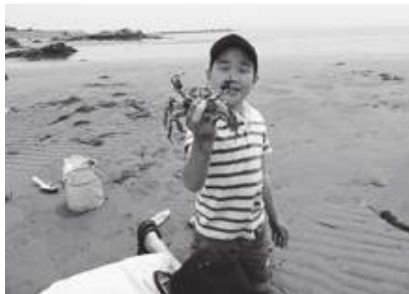
「カニを捕まえたヨ！」