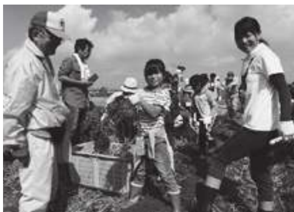
「こんなに大きな芋が」