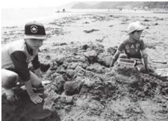
「トンネル掘りで遊びました」