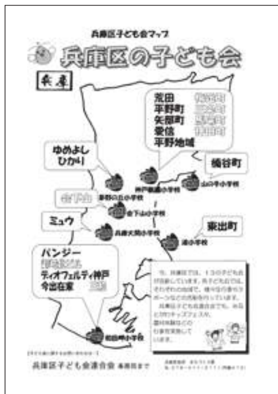
兵庫区子ども会マップ