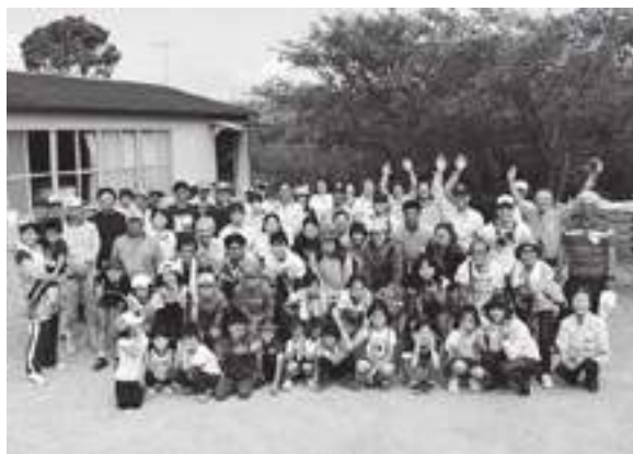
「H30稲刈り西区子ども会と交流しました」

区子連独自の行事としては、広報紙「兵庫の子ども会」を発行し、広報活動を通して子ども会の加入推進を図っています。また、潮干狩りや農村交流体験「稲刈り・いも堀り」の野外活動や、子ども自らが企画・運営・準備する「みなとがわキッズフェスタ」を開催し育成活動をしています。