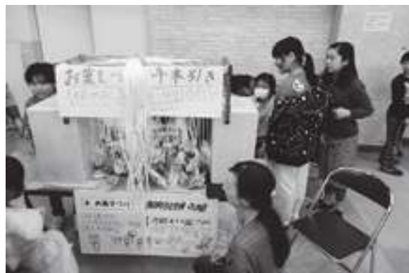
「お菓子作り 千本引きのお店」