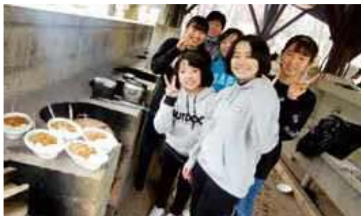
雨の中での野外炊飯