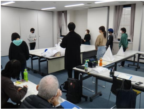
《プログラム説明リハーサル1》