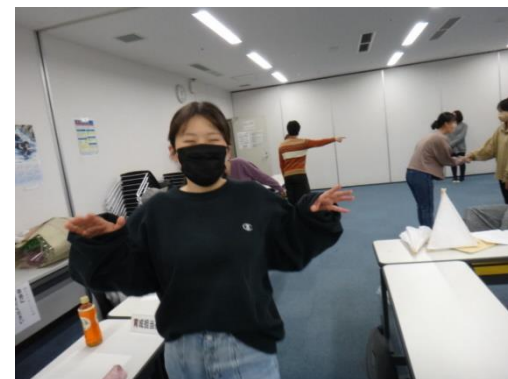
《レクリエーション演習》