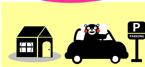
ゆめタウン光の森駐車場にマイカーを駐車