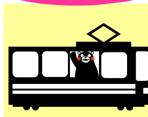
JRへ乗り換えて通勤