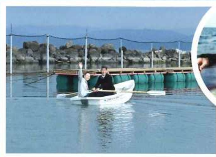
手こぎボート(定員2名)×5隻

手こぎボートでの釣りや固定イカダでの釣りをお楽しみいただけます。 可動式のイカダも2基ありますので、お手洗いやご用事の際はご利用になれます。