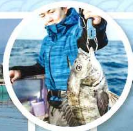
釣り堀から見る八代海の眺望