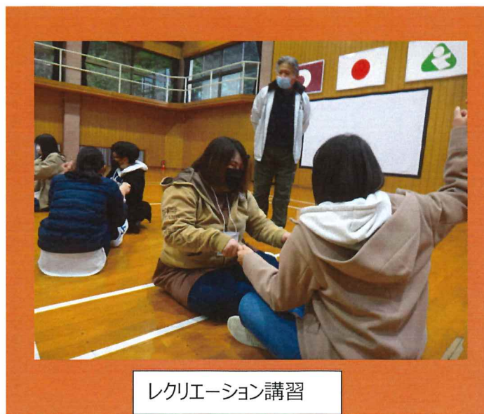
レクリエーション講習

古津副会長から KYT 講習を 2 H みっちりお互いの考えを交流しながら深めていきました。