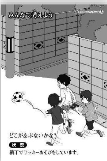
品番：C-005 横丁でサッカー