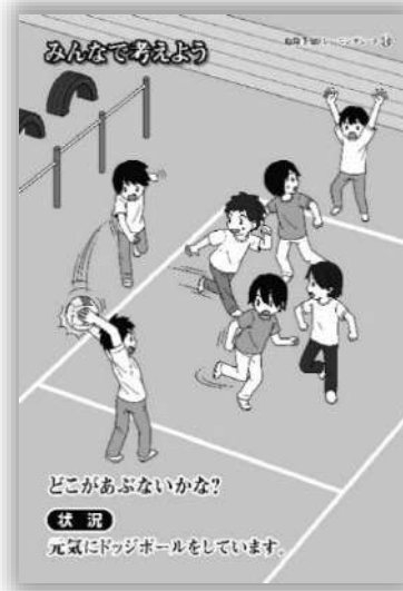
品番：C-014 ドッジボール