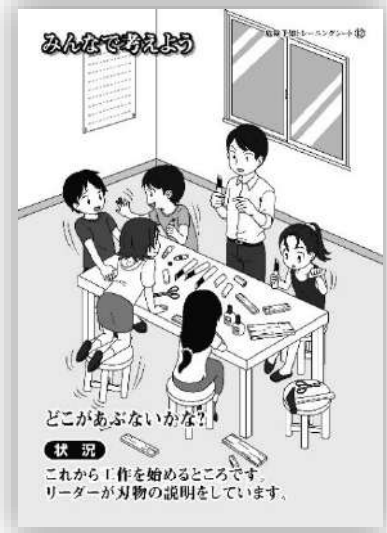
品番：C-012 工作を始める