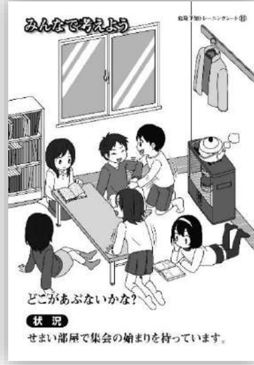
品番：C-011 狭い部屋で集会の始まりを待っている