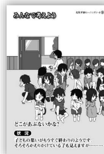
品番：C-008 集いの終わり