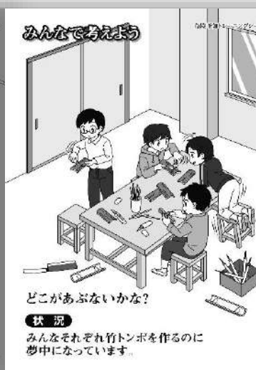
品番：C-019 竹とんぼ作り