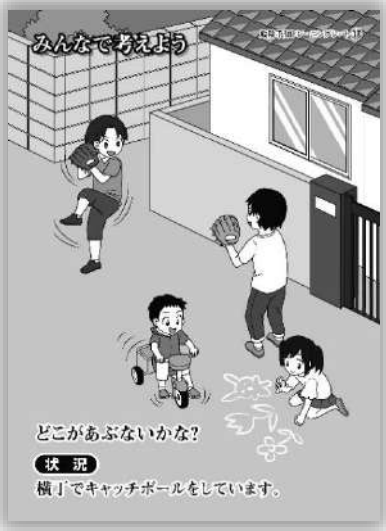
品番：C-013 キャッチボール