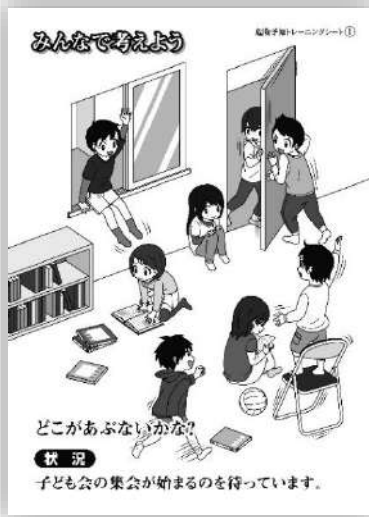
品番：C-001 集会の集まりを待っている