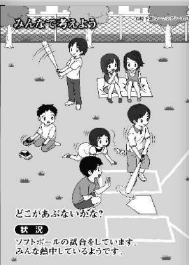
品番：C-017 ソフトボール