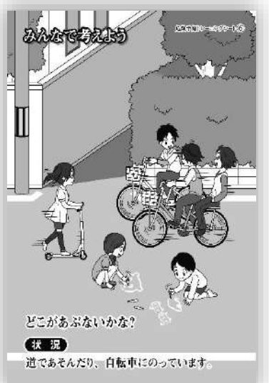
品番：C-006 道路遊び、自転車乗り