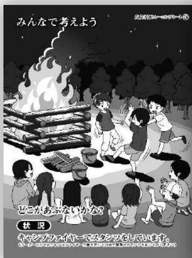
品番：C-016 キャンプファイヤー