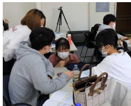
JL研修会の流れについて 検討し、一部変更を提案

ジュニア・リーダー定例会は3ヶ月のブランクがありましたが、みんな課題に向けて真剣に取り組み、研修会に向けての準備が出来ました。