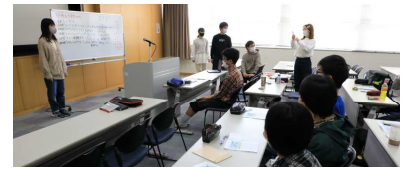
危険と気づいた人がその内容を発表