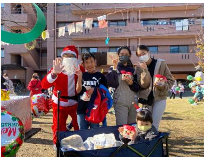
サンタさんから参加賞をもらいました