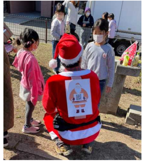
サンタの背中に最終ミッション