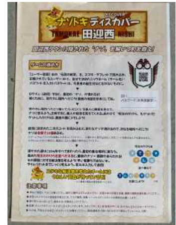
当日配布されたチラシ(表)