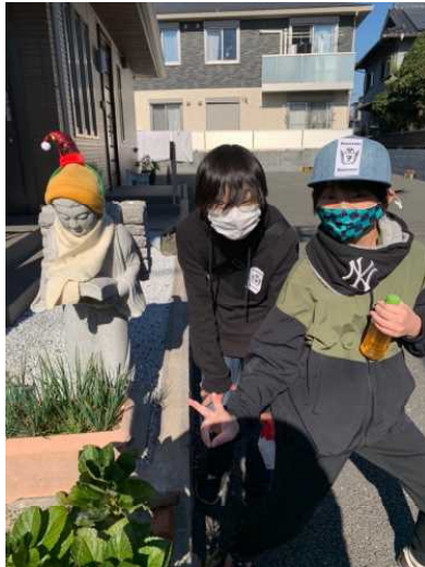
二宮金次郎撮影スポット (ここでチョコのつかみ取りもできます)