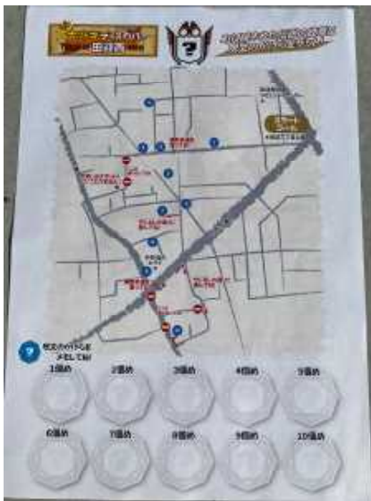
当日配布されたチラシ(裏)