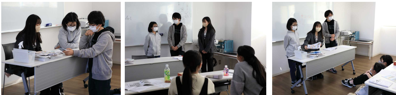
どのゲームが良いか話し合い中