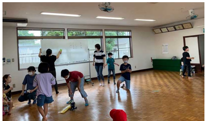
楽しかった竹とんぼ遊び