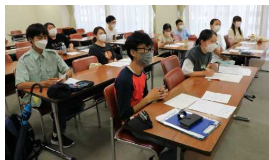
阿蘇キャンプの反省・気づき