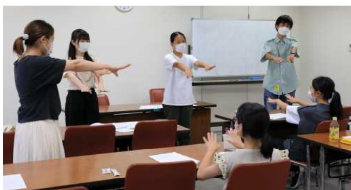
レク練習：ウルトラマンの夜回り