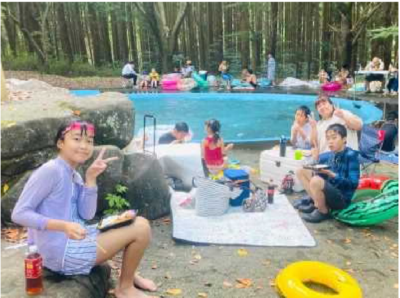
家族ごとに 楽しく食事