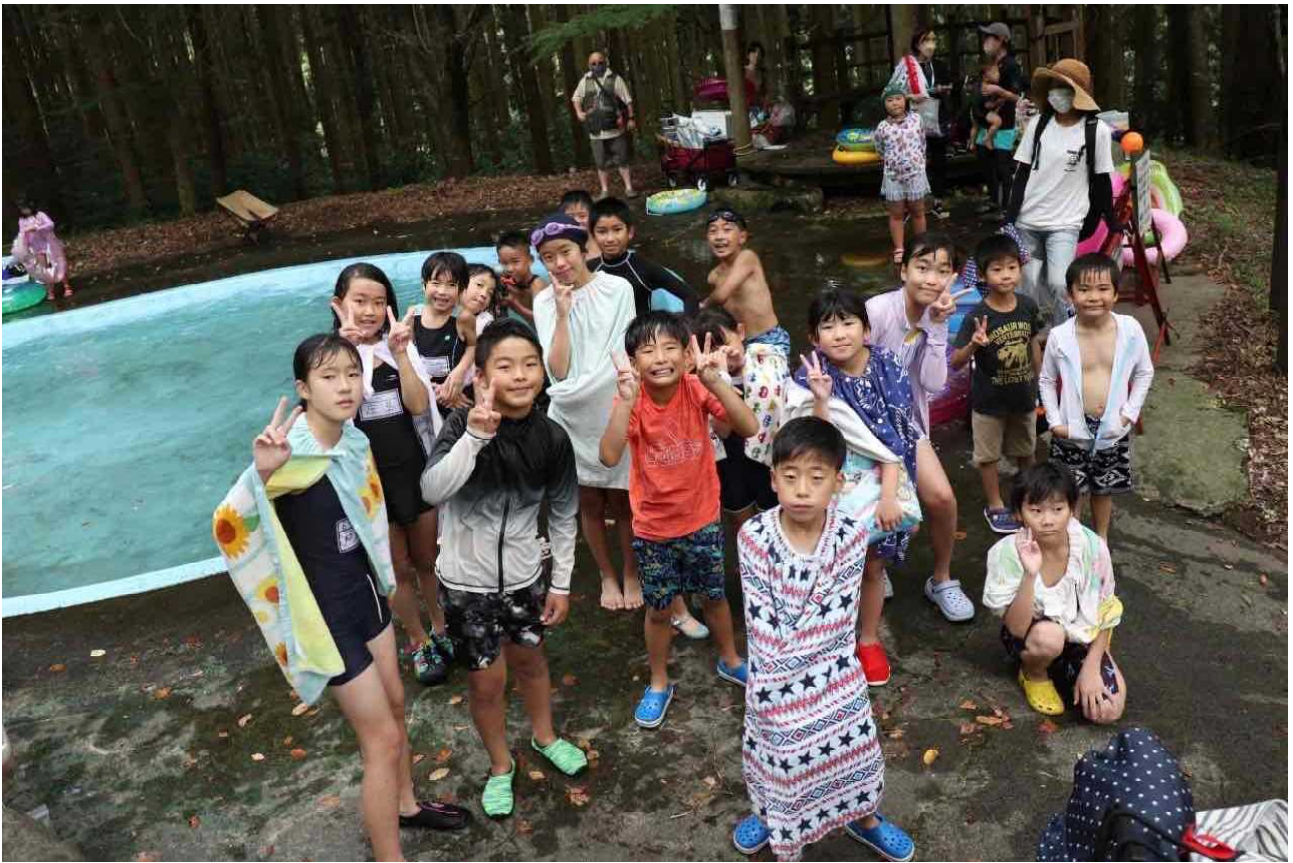
水遊びを十分楽しみました