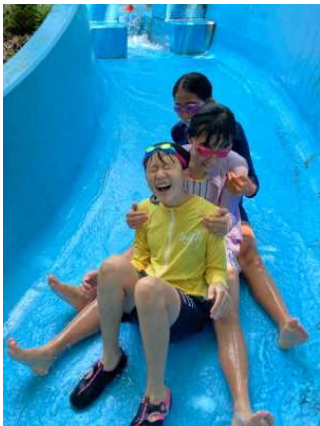
ワァー スリル満点

コロナ禍で色々活動も制限されるなか、自然の中で子供達に素敵な夏の思い出の一つとなる活動が出来たことを嬉しく思います。