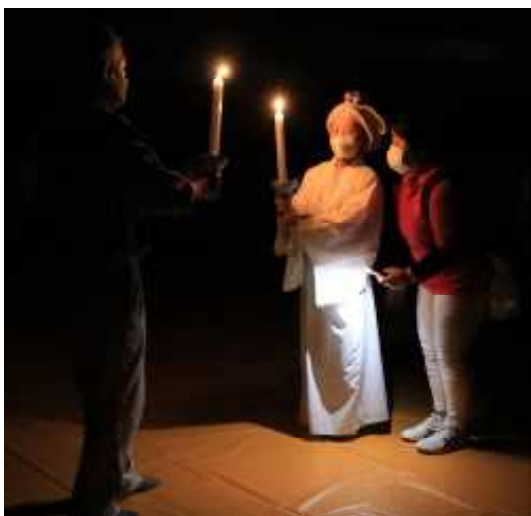
女神から火の長へ分火