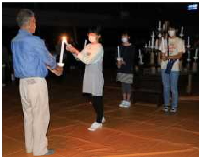
火の長から班長へ分火