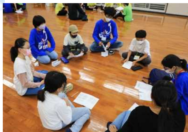
班ごとに話し合い