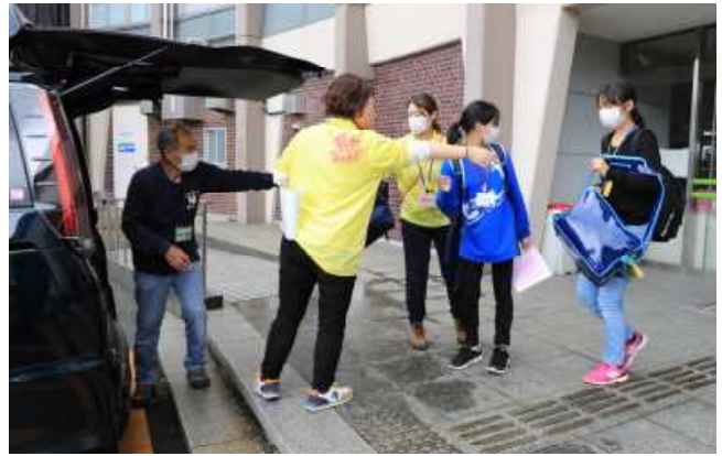
大きなバッグの積み込み