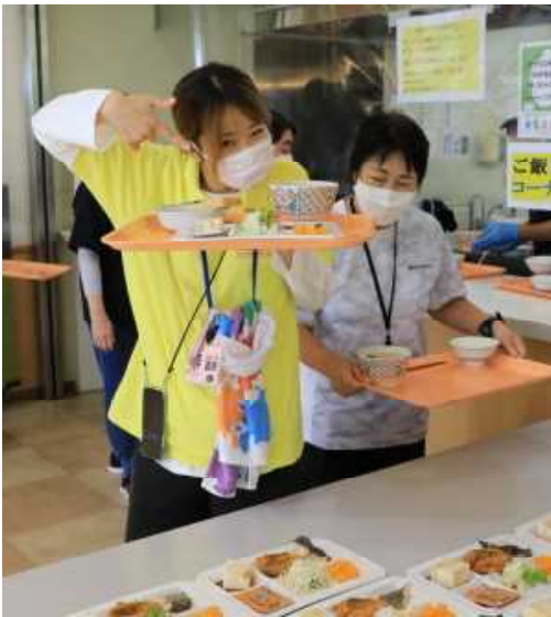
「美味しすぎてごめー」