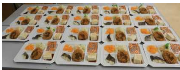
食事は 大変美味しかった