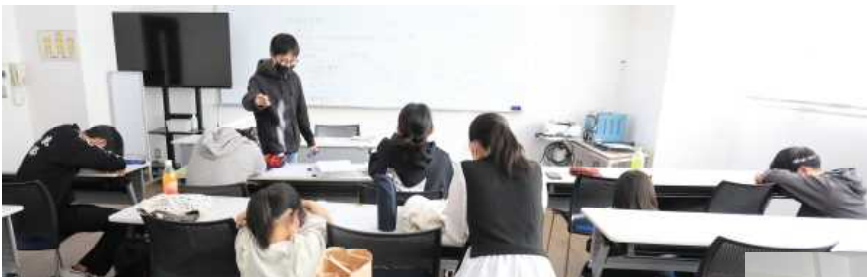
レク：「ウインク事件」についての説明と実演