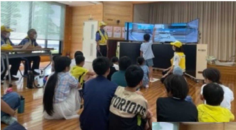
学年に応じた内容のシミュレーターで 1人1人体験