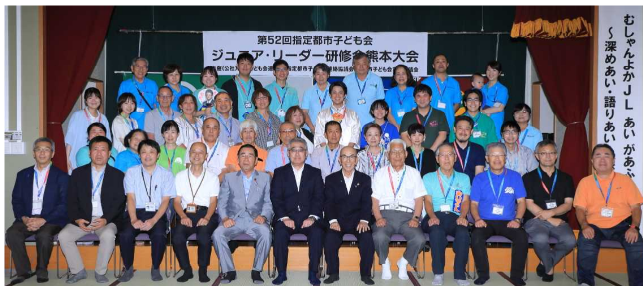
来賓・役員・引率・YL・スタッフ