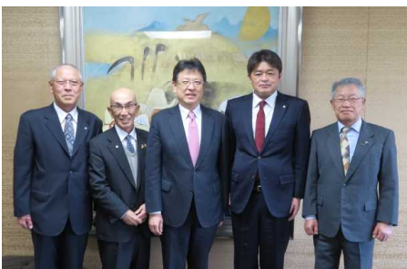
市長表敬訪問 (全子連・指定都市子連役員、市子協役員)