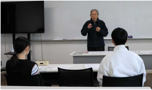
「子ども会しおり」について