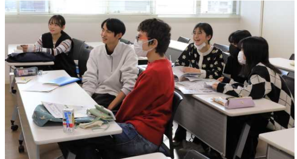
JL研修会 活動内容について