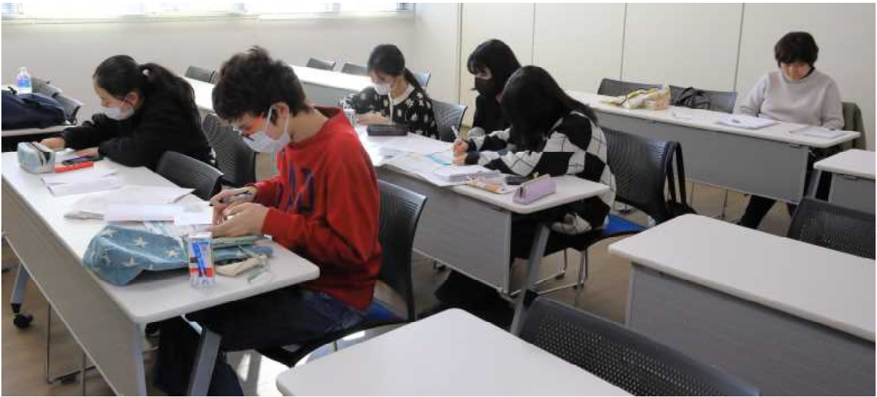
JL 研修会 しおり作り