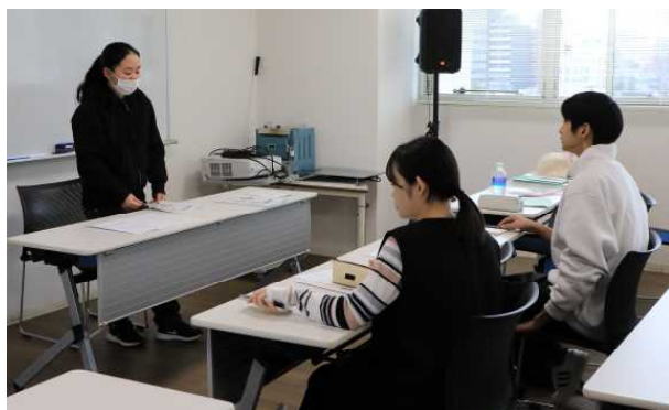
高3近況報告・今後の動き