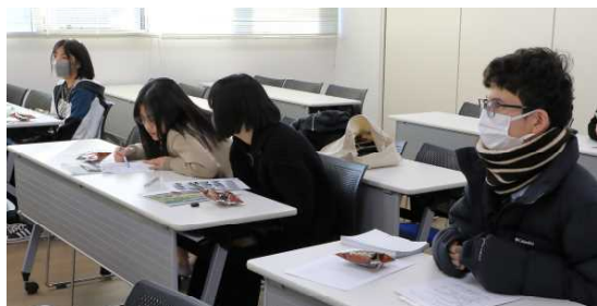
JL研修会 レクについて