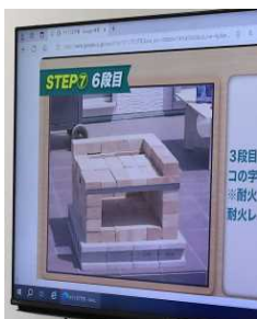
JL研修会での ピザ窯作りについて