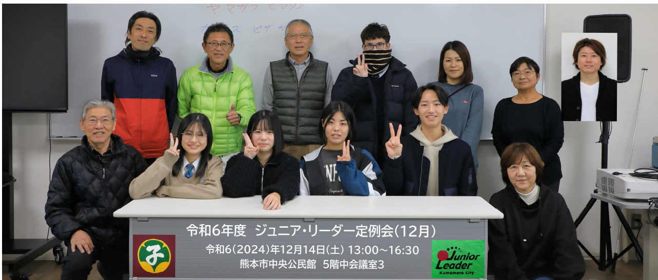
令和6年度 ジュニア・リーダー定例会(12月)