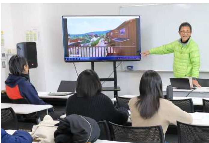
「ヤマガラビレッジ」について