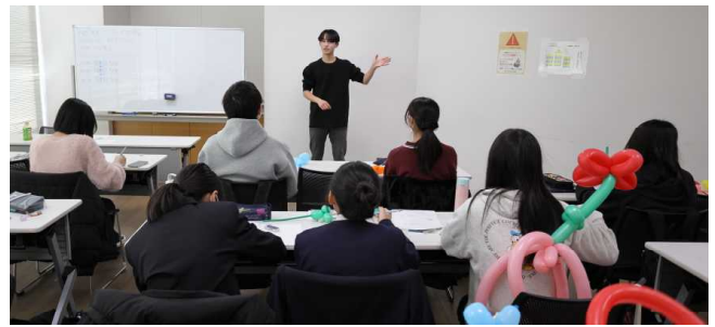
子ども会大会について