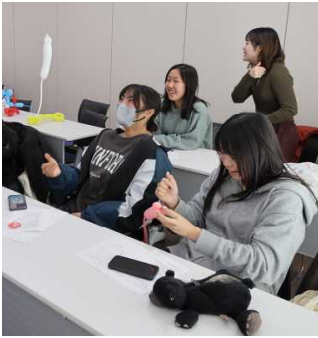
バルーンアート 跳びネズミ