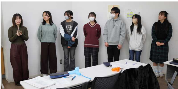
向山3子ども会への派遣YL・JLの感想発表