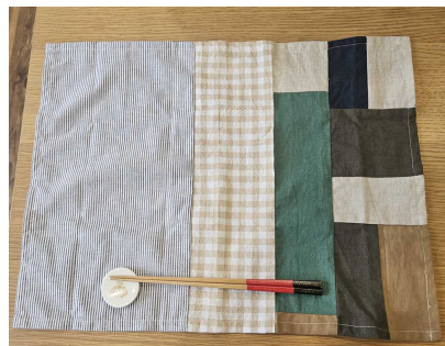
6年生 ランチョンマット♪