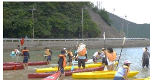
県ジュニア・リーダー研修会