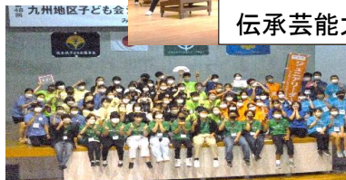
九州ジュニア・リーダー研修

●年齢の異なる集団活動をとおして、礼儀やルールなど 社会性 を身につける事ができます