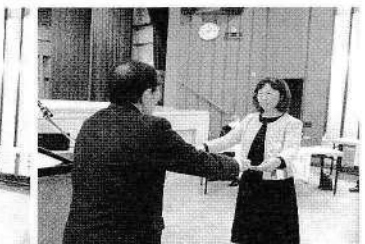
下組郷子供育成会 様