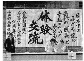
熊本市立必由館高等学校