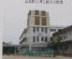
平成3年建設された新校舎