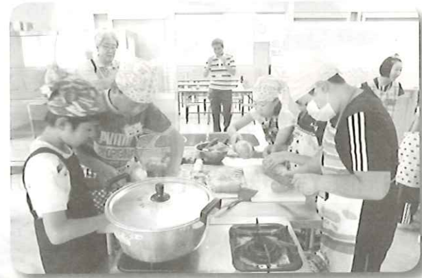
佐野市子連ジュニアリーダー研修会