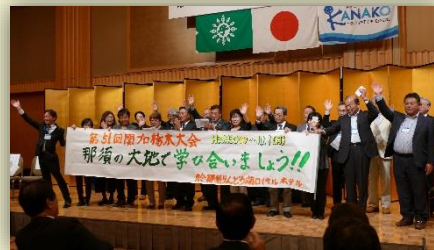
次年度大会PR横断幕