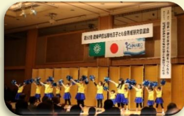
アトラクション(チアガール)