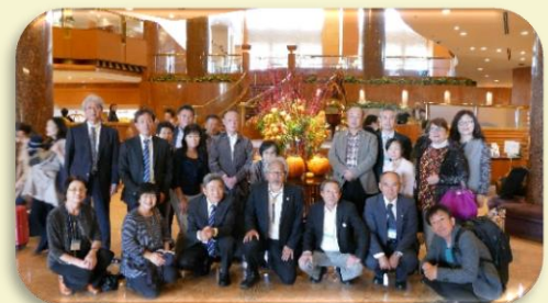
栃木県からの参加者