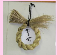
中に好きな文字を書いた色紙を入れ完成