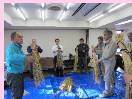
杵子講師が手塩にかけて育てた稲の藁を使って