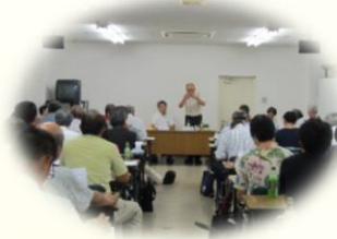
最後の実行委員会