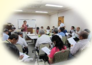
分科会の進行予行演習

また、それに先立ち第1～第6分科会では17時からコンサーレ会議室において本番さながらの分科会協議進行のシュミレーションを行いました。