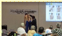
上級指導者研修会 →

安全啓発上級指導者研修会開催 1月25日(土)～26日(日) 全子連主催 国立リハビリテーションセンター