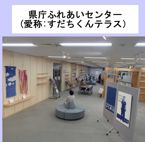
県庁ふれあいセンター (愛称:すだちくんテラス)