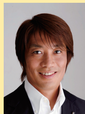
中西哲生氏 スポーツジャーナリスト