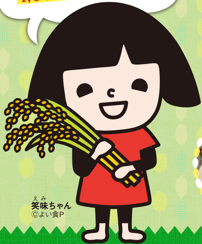
えみ 笑味ちゃん