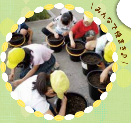
みんなで播まそう!

バケツ稲づくりに参加した お友達は、平成元年から30年までで 1,000万人 を超えました!