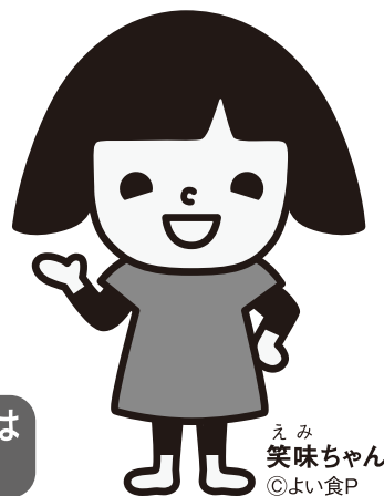
えみ 笑味ちゃん ©よい食P