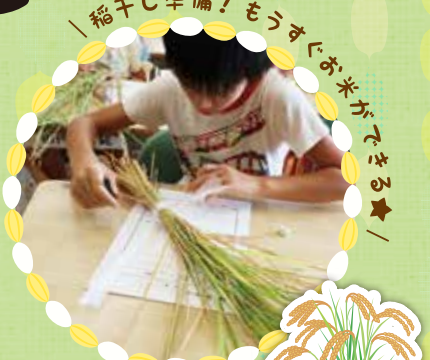
稲干し準備! もうすぐお米がでる★!