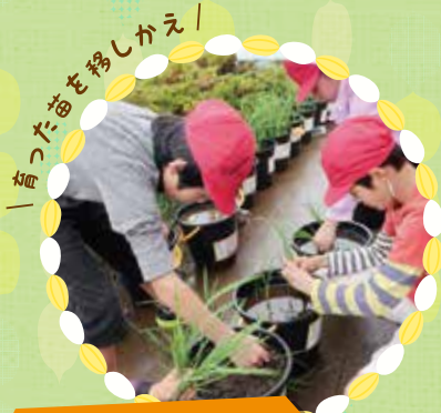
育った稲をゆしかえ!