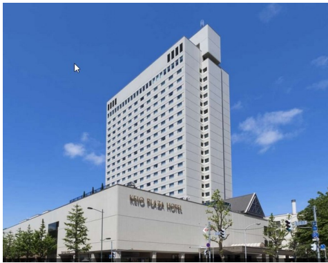
10月27日(金) 京王プラザホテル札幌