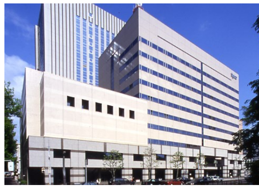
10月28日(土) 北海道立道民活動センター かでの2・7