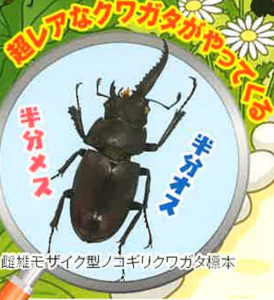
雌雄モザイク型ノコギリクワガタ標本