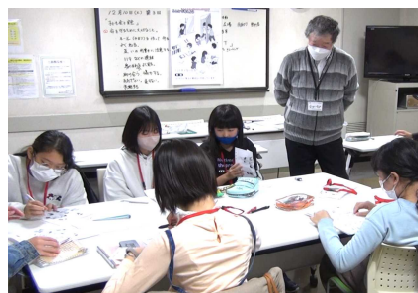
昨年度の様子（KYT研修）

ぜひこの講座に参加して、あなたの「まち」の子ども会の「ジュニアリーダー」になりませんか。